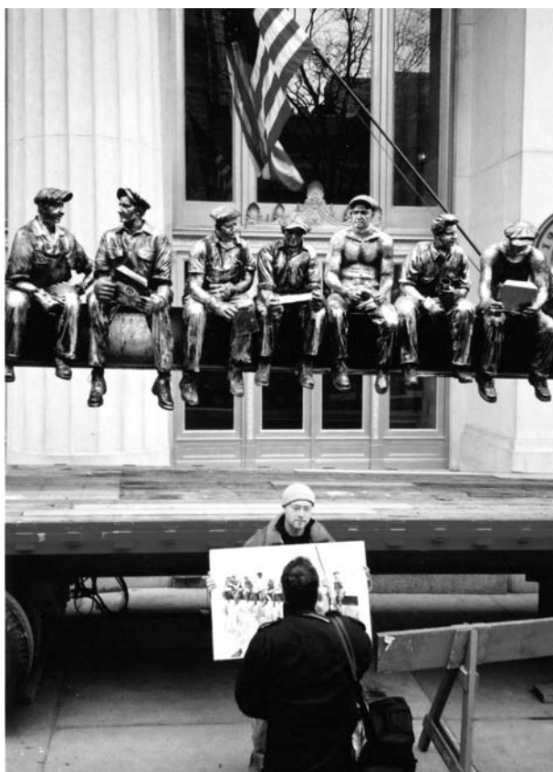
B. Gervais, Lunchtime atop Ground Zero. 2 , 2002.

Me voici rendu au cœur de mon récit. J'entends rester le plus proche possible des événements. Je ne sais pas s'ils parlent par eux-mêmes, mais c'est un matériau d'une richesse qui m'étonne encore, après toutes ces années.