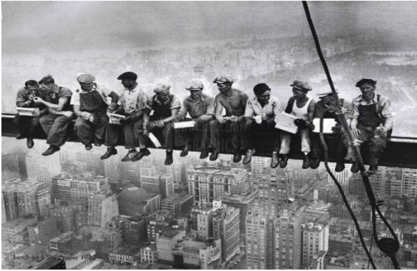
Charles C. Ebbets, Lunchtime atop a Skyscraper , 1932