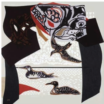
Le huart, illustration de René Derouin