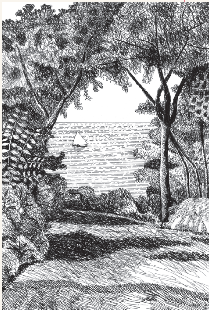
Dessin de Richard Aeschlimann tiré de La Grotte de Vénus , 2012.

Si une telle atmosphère de rêve est possible en plein cœur du pays calviniste, c'est en grande partie dû aux personnages mis en scène par Pierre Girard : qu'ils soient genevois, anglais ou américains, ils ont en commun non seulement une certaine familiarité avec les féeries shakespeariennes, à commencer par Le songe d'une nuit d'été , mais aussi une sensibilité musicale qui les porte volontiers vers les romantiques