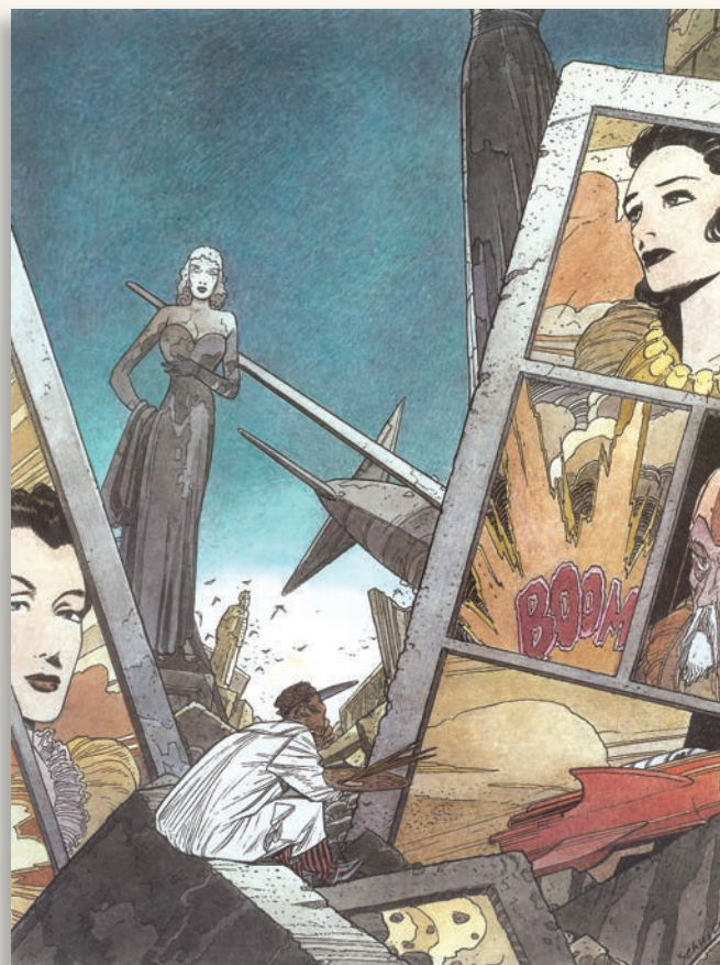
Illustration de François Schuiten pour la couverture du n° 16 de Nuit blanche « Spécial BD : La crise », hiver 1984-1985.