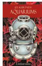
J.D. Kurtness AQUARIUMS