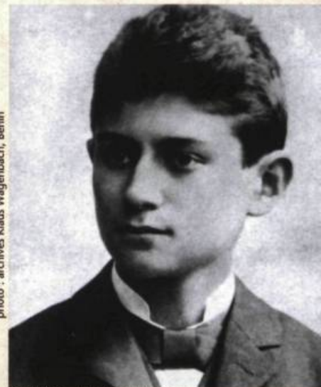
Franz Kafka à dix-huit ans, 1901