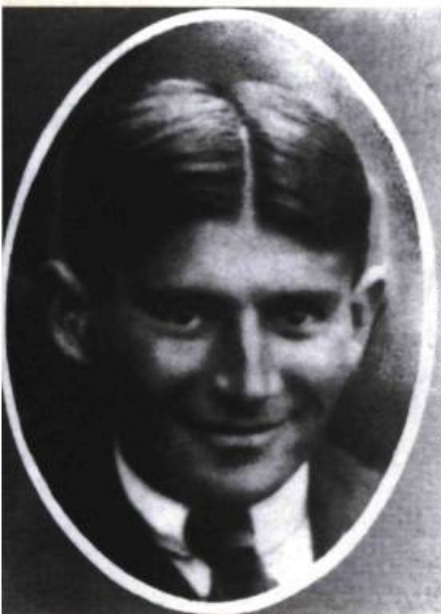
Franz Kafka à trente-huit ans, 1921