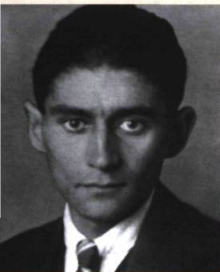
Franz Kafka à quarante ans, 1924

Tout ça, c'est la langue, c'est donné par la langue. Dans son cas, il savait, il sentait et l'entourage hostile dans lequel il vivait le lui faisait sentir naturellement, il savait qu'il n'avait pas reçu cela en partage. Il n'avait pas, si vous voulez, la langue allemande de naissance, il l'avait encore un peu par hasard, et encore une fois bien qu'il n'en eût pas d'autres. Il faut bien se représenter cette façon de vivre intérieurement un phénomène extérieur, dont, encore une fois, il aurait pu s'accommoder.