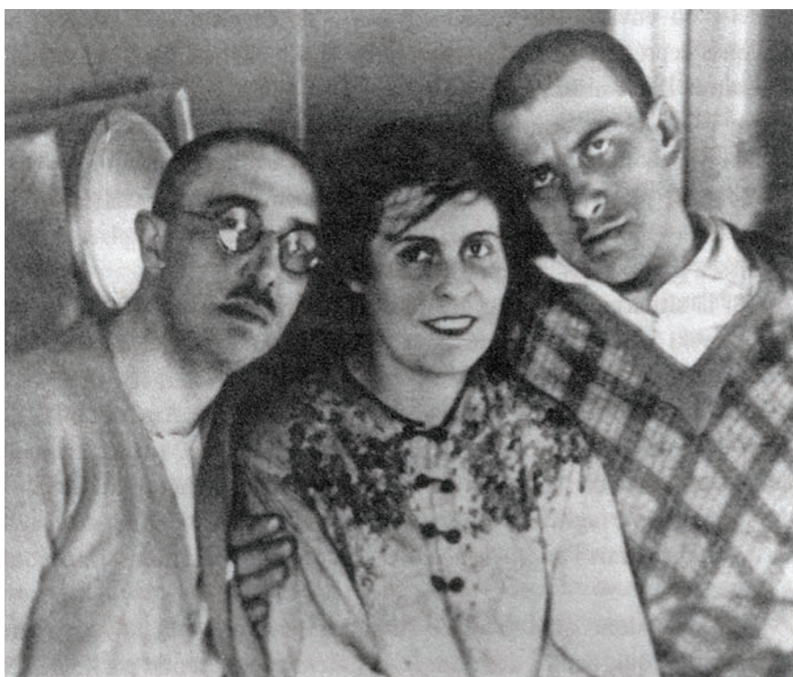
Une des rares photos réunissant Lili, Ossip et Maïakovski prise en 1929