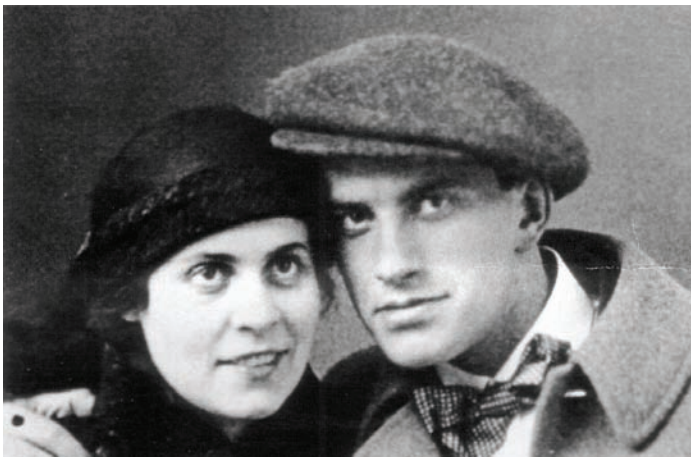
Lili Brik et Vladimir Maïakovski