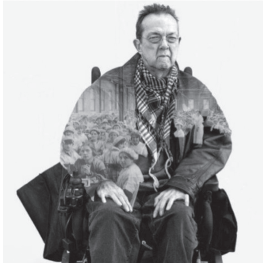
Photographie : Thanh Pham, tirée de l'affiche du film The Good Fight

Afin de vous donner un aperçu de l'approche de Fennario, nous vous présentons ici deux textes. Tout d'abord, une entrevue réalisée avec lui récemment 1 , par John Bradley, un de ses amis militants de Verdun. Ensuite, un extrait de la pièce de théâtre Bolcheviki, écrite par Fennario en 2009. Yves Rochon a assuré la traduction des deux textes de ce numéro.