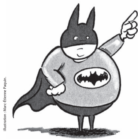
Illustration : Marc-Étienne Paquin.

Le journal d'Aurélie Laflamme. Les pieds sur terre. India Desjardins. Montréal, Les Intouchables, 2011, 504 pages.