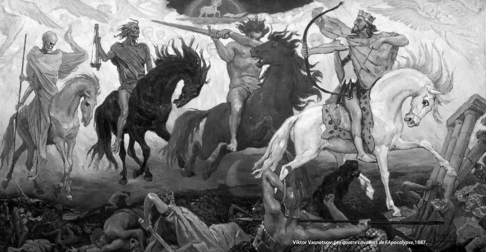
Viktor Vasnetsov, Les quatre cavaliers de l'Apocalypse , 1887.

— En annonçant dans son Apocalypse plusieurs catastrophes, Jean veut-il laisser entendre la fin d'un monde ancien, qu'il dénonce, par rapport à un monde nouveau qu'il espère et qui reposera sur la justice ?