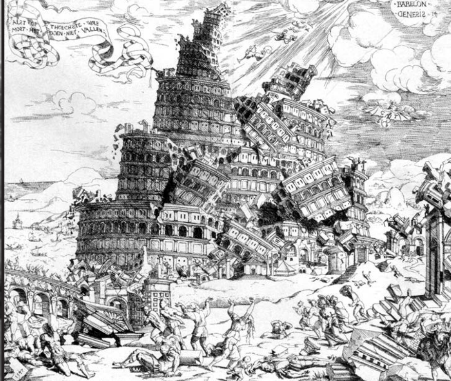
> Cornelisz Anthonisz, La Destruction de la Tour de Babel, vers 1505-1553.