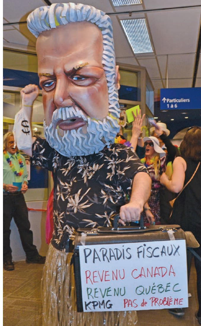
Des militants de la Coalition Main rouge ont donné un air de paradis fiscal à Revenu Québec, le 31 mars 2016, pour dénoncer la complaisance du gouvernement Couillard face à l'évasion fiscale des plus riches.

N'eût été du budget fédéral, présenté quelques jours après celui du Québec, on aurait peut-être cru que tout cela était dans l'ordre des choses de l'ère néolibérale où, par ailleurs, le gouvernement se prive volontairement d'importants revenus fis-