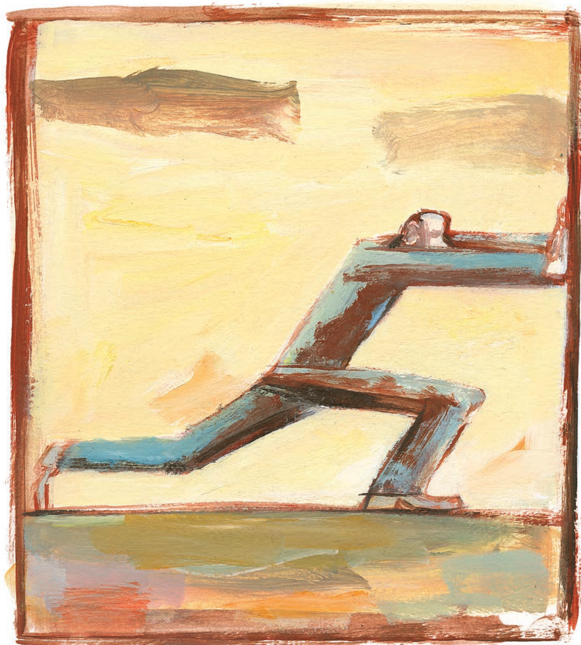
Pierre Pratt, À propos du carré 1 , 2006. Artiste invité du n° 774 (octobre 2014)

L'acte de créer, d'innover, d'initier de nouveaux commencements est au cœur de l'existence humaine et au cœur du combat pour une société juste. Souhaiter un monde meilleur passe inévitablement par l'acte d'imaginer un monde différent et de lui donner corps. De l'art à la religion en passant par le politique, l'économique et le social, la création est un mouvement d'expressivité et une quête de liberté qui se déploie dans tous les domaines de l'activité humaine. Elle s'ancre dans un héritage qu'elle tente de renouveler, dans une tension qui accouche sans cesse du monde.