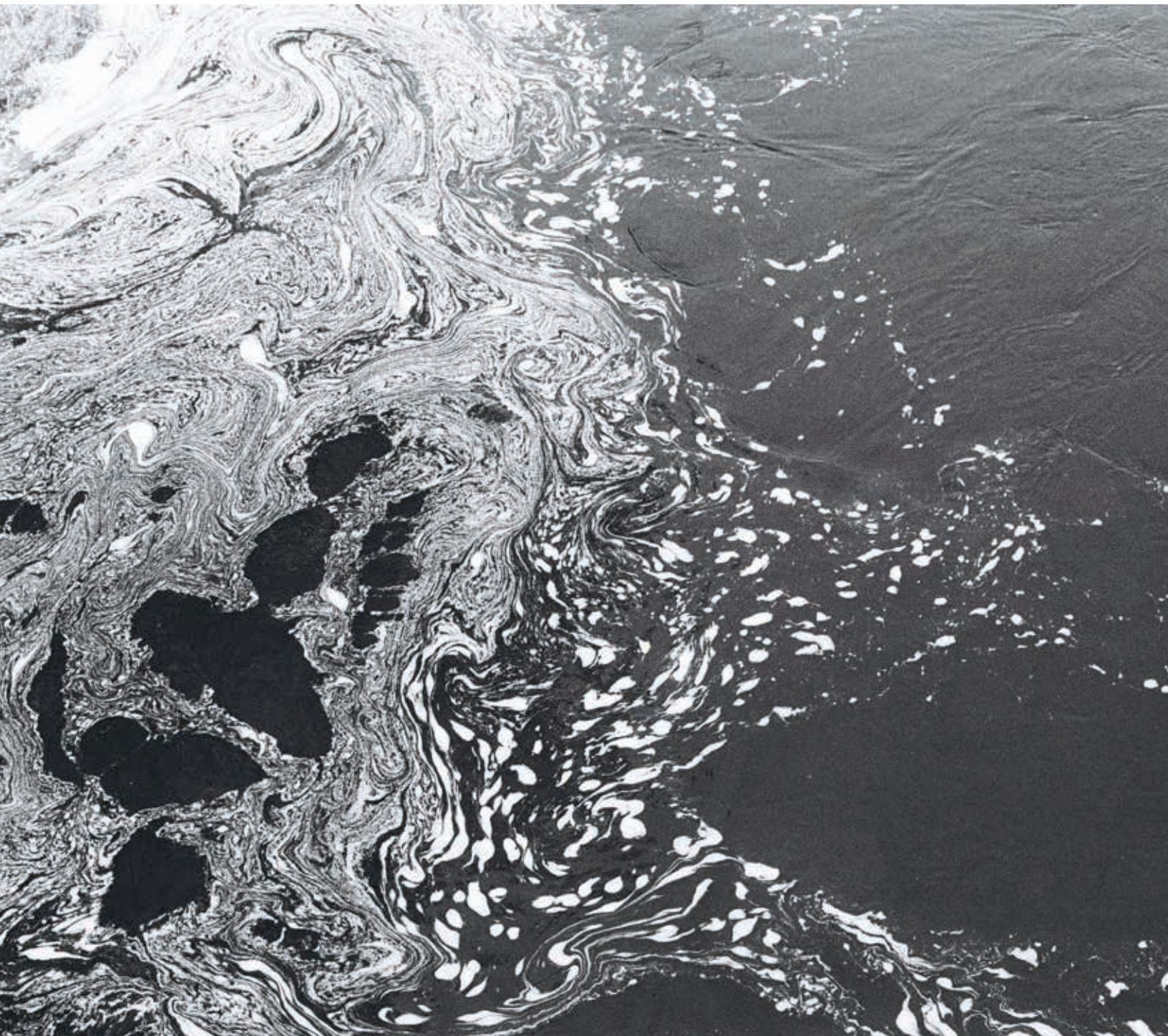
Sueur , Baie Johan, 2017