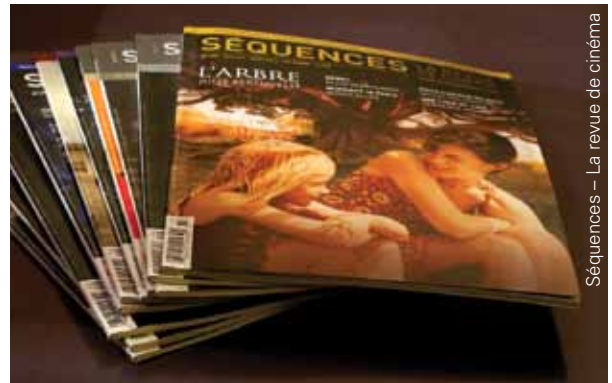
Séquences — La revue de cinéma

Mais ne vous fiez pas à elle. Voyez plutôt ce que son portfolio inspire.