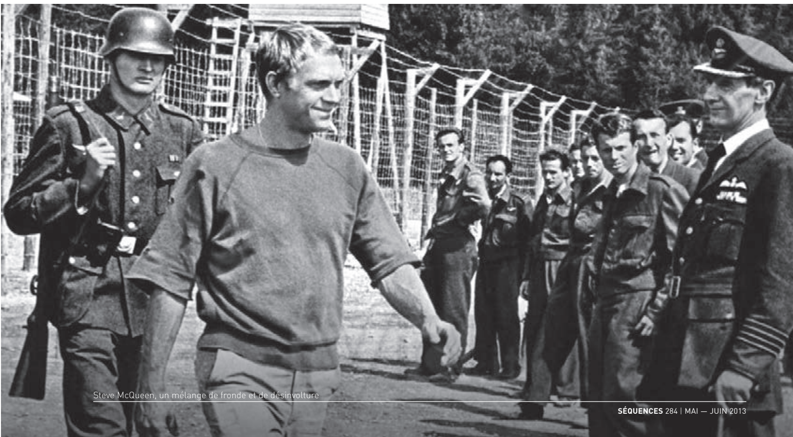
Steve McQueen, un mélange de fronde et de désinvolture