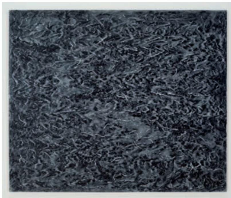
Détail d'un tableau en cours, acrylique sur toile, 102 x 122 cm, 2013

Avant de se plonger tête première dans la peinture, Verret avait déjà beaucoup exploré le travail photographique, à l'époque de l'analogique. C'est par ce