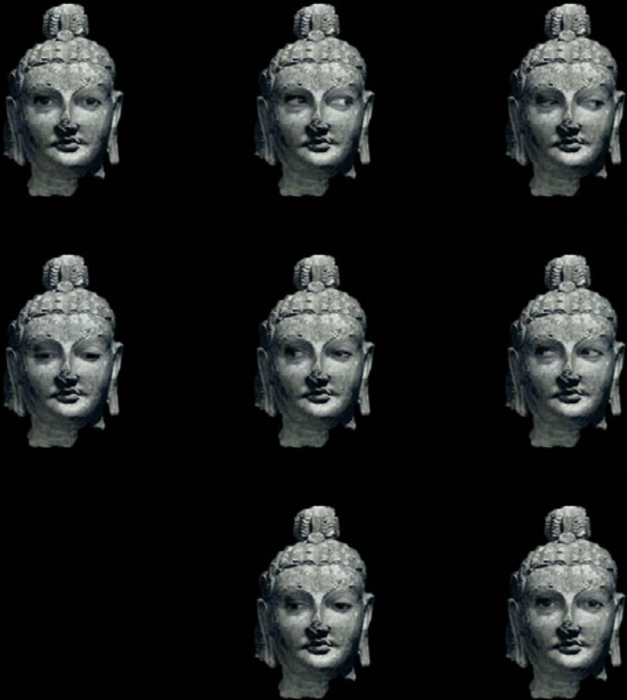
Bouddha de la collection du Musée de Kaboul - 1, 2002 Techniques mixtes, 115 x 158 cm Projection vidéo et cadre de bois, 115 x 158 x 4,3 cm, Collection de l'artiste