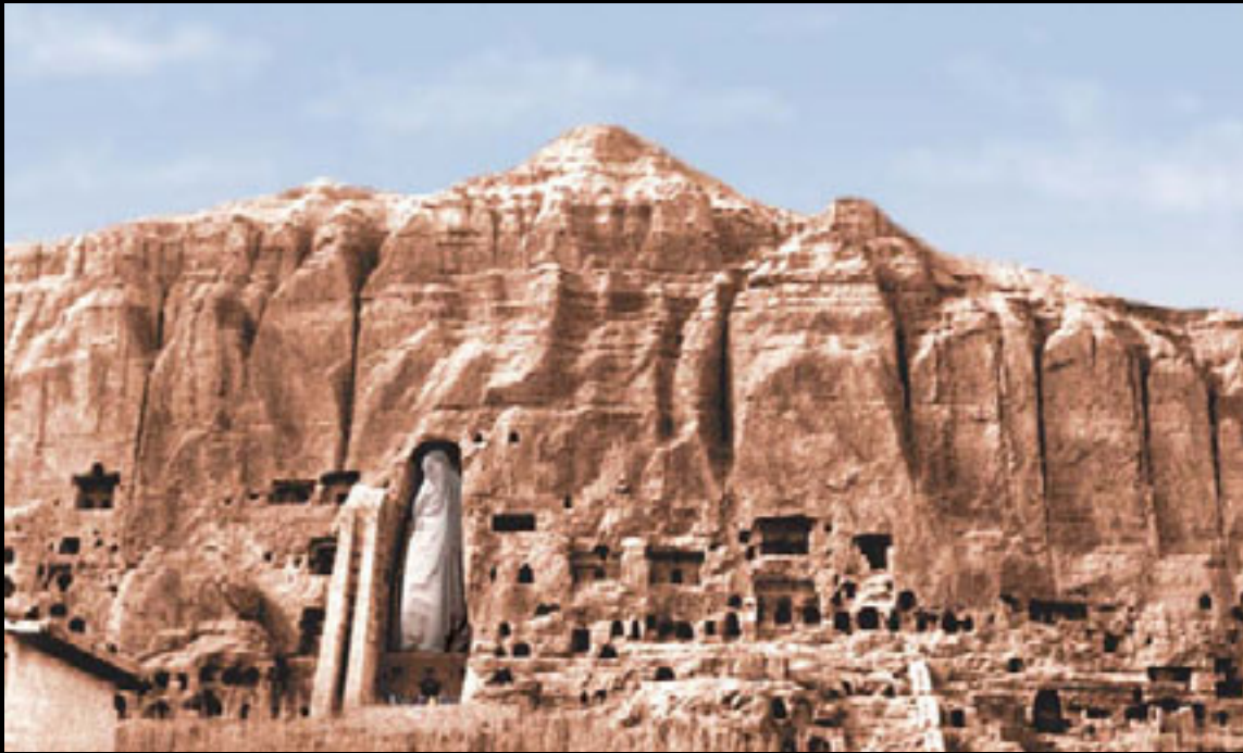
Bamiyan, 2003 Impression à jet d'encre sur papier, 53,3 x 71,1 cm

le terme latin « merveille », qui fait référence à Mirabilia Urbis Romae ( Les merveilles de la Cité de Rome ), un petit ouvrage du Moyen Âge, datant de 1143, qui servit de guide sur l'histoire, les sites et les monuments antiques et médiévaux de la Ville éternelle à plusieurs générations de pèlerins et de touristes.