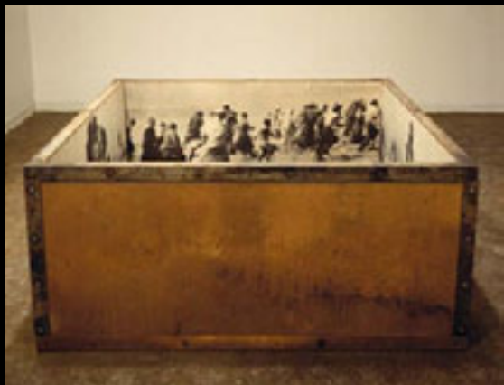
Bois, acier, émulsion sur film, 76,2 x 182,8 x 182,8 cm Collection : Musée des beaux-arts de l'Ontario, Toronto ; Photo : Richard-Max Tremblay