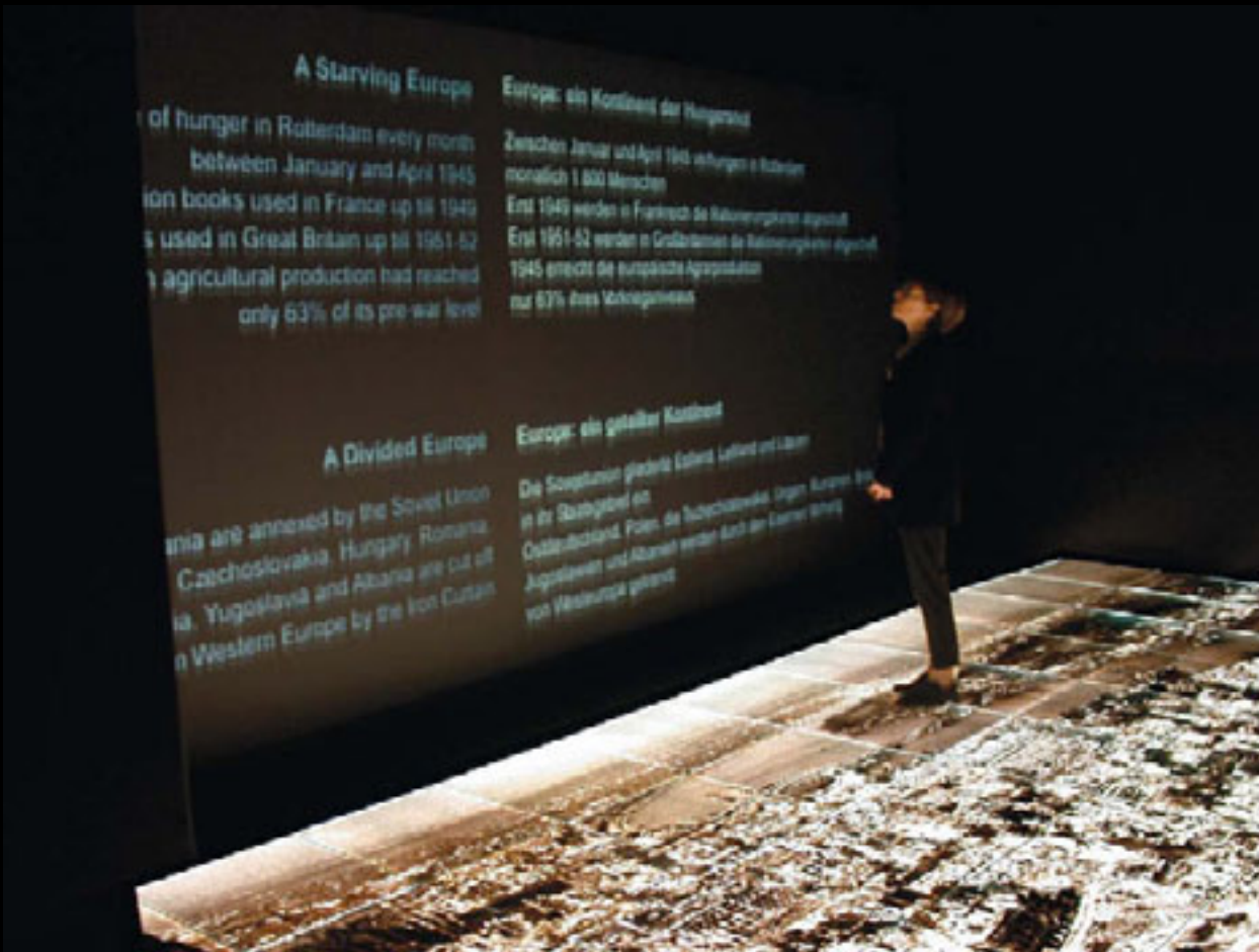
Europe année 0, 2007-2009 Impression numérique, vidéo, tuiles lumineuses (DEL), dimensions variables Collection : Musée de l'Europe, Bruxelles

Les trente-huit masses de verre stratifié sont percées, empruntant les contours de la forme d'une œuvre ou d'un monument perdu, volé, spolié, pillé, saccagé, démantelé et parfois même retrouvé. Ces blocs posés sur la terrasse, jonchée de cailloux de marbre blanc, forment une grille évoquant une cité perçue à vol d'oiseau, mais aussi le profil d'un sarcophage. Cette configuration, selon certains, pourrait agir comme allégorie d'une nécropole. Mais l'artiste insiste : avec Mirabilia , elle souhaite au contraire rendre hommage et redonner vie à ces artefacts en les déposant dans notre imaginaire. Chacun des monolithes béants rappelle, par exemple, l'un des deux Grands Bouddhas de Bâmiyân, détruits par les talibans en 2001 ; des masques Haida confisqués par un agent du ministère des Affaires indiennes en 1921 lors d'une cérémonie potlatch en Colombie-Britannique ; l'un des quatre Chevaux de la Basilique San Marco à Venise, d'abord subtilisés à l'Hippodrome de Constantinople, en 1204, par les Vénitiens, puis enlevés par Napoléon en 1797 pour être finalement retournés à Venise après la défaite de l'empereur à Waterloo ; la sculpture monumentale Tilted Arc de Richard Serra, démantelée en 1989 à New York ; un vase Warka (3 000 av. J.-C.), subtilisé au Musée de Bagdad en 2003 et rapatrié, en morceaux, six mois plus tard ; le Crucifix de Cimabue (1270) à Florence, endommagé par les inondations