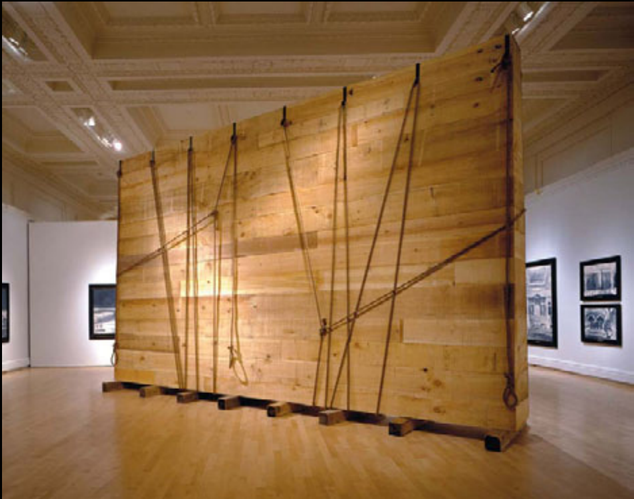
Monuments, 1998 Émulsions sur film, bois. Dimensions variables (caisse de bois de 8 m x 4 m x 1 m) Présenté à la Galerie de l'UQAM, Montréal (2004). Collection : Musée national des beaux-arts du Québec