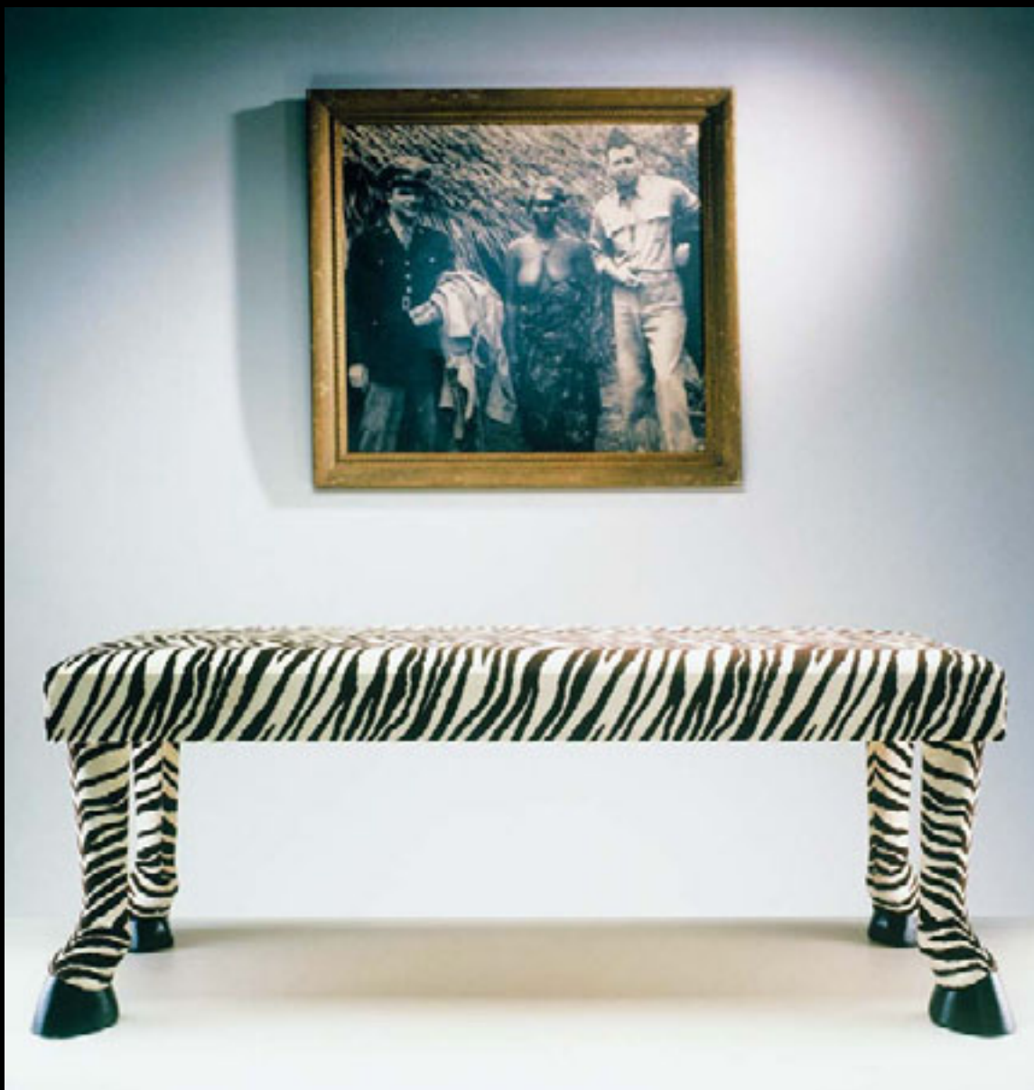
Big Game 1, 1987 Techniques mixtes

Collection : Musée régional de Rimouski