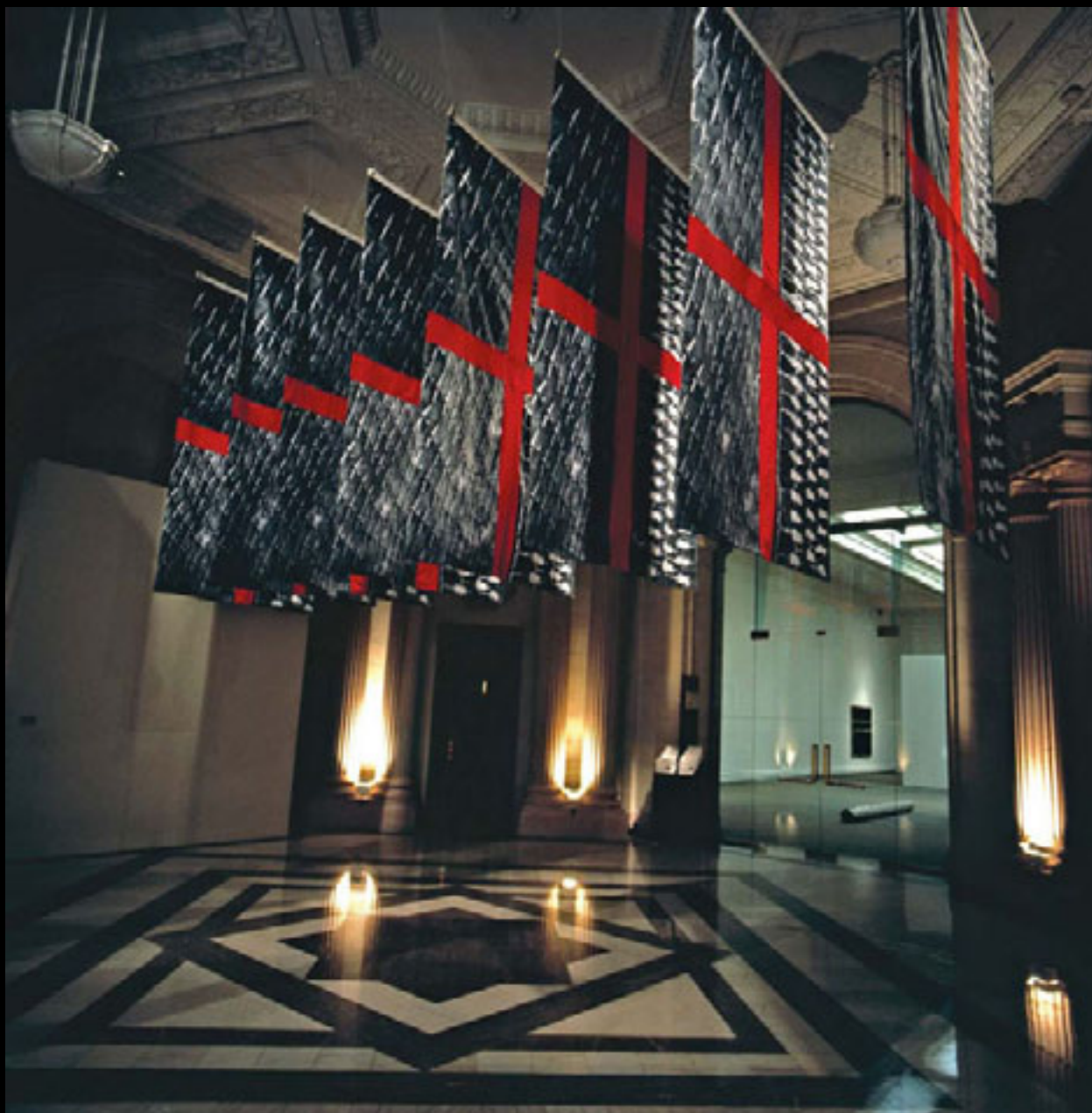
Stars and Stripes, 1985 Sérigraphie sur tissus (12 panneaux), 175,2 x 335,2 cm Collection : Musée national des beaux-arts du Québec