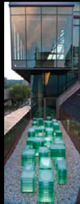
Mirabilia (arcades de Montréal, Architectes : Provencher Roy Associés