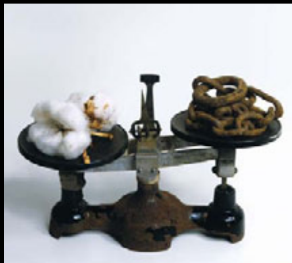
Balance, 1991 Assemblage (balance, chaîne et fleurs de coton), 22 x 35,5 x 17 cm

Le projet Mirabilia suggère à la fois le mandat principal de toute institution muséale, soit la collection et la conservation des œuvres et des monuments du patrimoine artistique, et