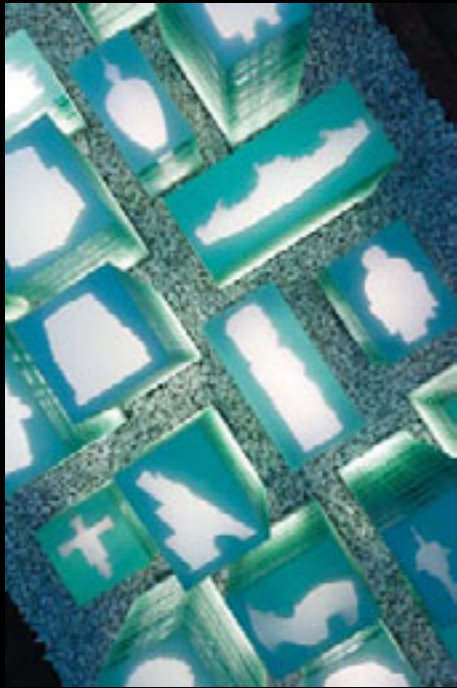
Mirabilia (détail)