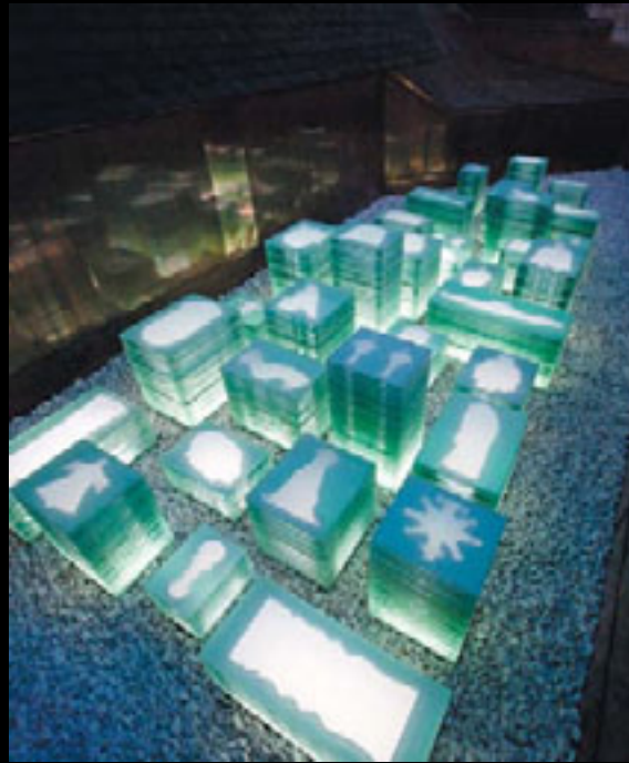
Mirabilia (nuit)

de 1966 ; une tête de déesse, provenant d'un bas-relief du Palais d'Angkor Vat au Cambodge, arrachée et pillée par André Malraux en 1923 ; la Croix de Pierre Ayot , l'une des dix-huit œuvres démantelées par l'administration Drapeau lors de l'événement Corrid'Art en 1976, etc. L'objet disparu se manifeste à nous en creux dans le monolithe de verre, son pourtour et son centre nimbés de lumière suggérant sa forme et son volume. Un objet auratique, fantomal en somme. La conjugaison des pleins, des vides et de la lumière rend vivantes les œuvres recherchées. L'éclairage électrique nocturne, émanant des cubes, anime cette ville dans la ville comme une illumination qui ravive notre mémoire.