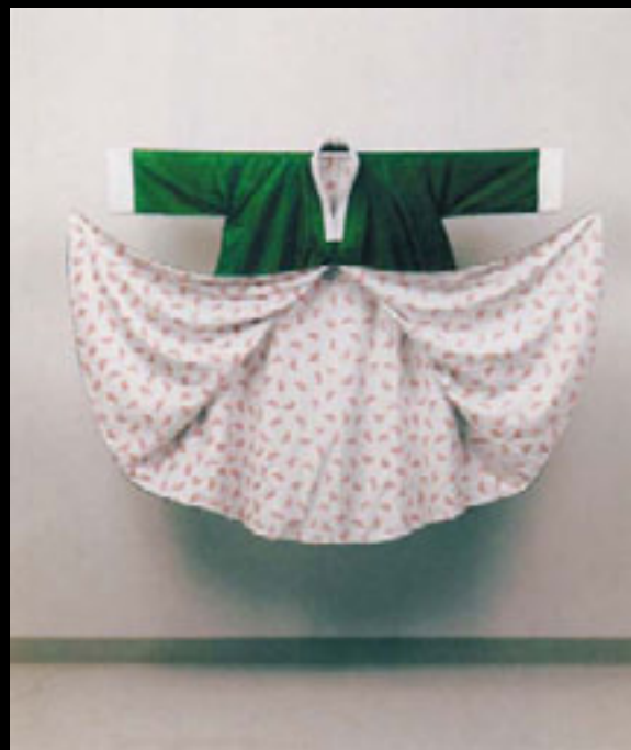
Japan Apologizes, 1993 Soie, coton encre, 1,8 x 1,2 m

C'est ainsi que Blain s'est appliquée à une prospection approfondie des matériaux qui ont constitué le musée depuis sa création en 1912, en l'occurrence le marbre, la pierre calcaire, le béton, la brique et le verre, et aux images que ceux-ci évoquaient. Le marbre