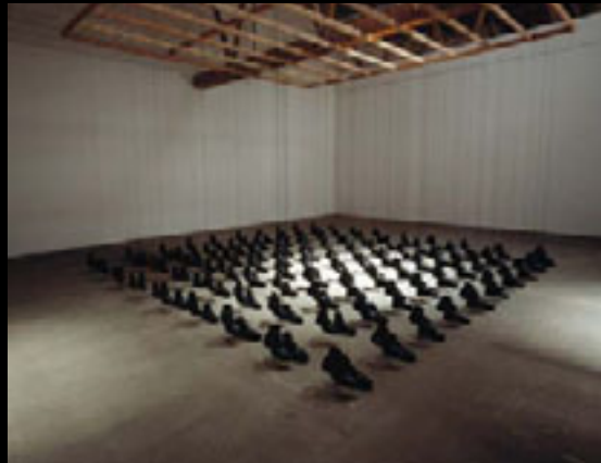
Missa, 1992 Bottes d'armée suspendues, grillage métallique, fils de nylon, 7 x 7 m Collection : Musée des beaux-arts de Montréal

faut y regarder de plus près puisque les œuvres cachent moult détails qui s'ajoutent à notre vue, par sédimentation, au fil de nos lectures. L'accumulation de ces éléments amplifie l'aspect infâme d'une situation évoquée.