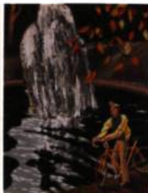
1- Mimi Côté Madame Baltic , 2002 Aquarelle 25 x 20 cm