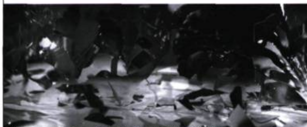
© Gwenaël Bélanger, Le Feu mouvement (7' - 120"), 1/6, 2008, impression jet d'encre, 101,6 x 274 cm.