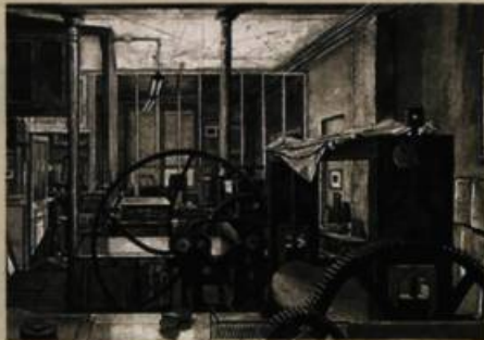
Atelier René Tazé VII (détail), 2008 Eau forte, aquatine et roulette 44,5 X 82 cm

Tél. : 514 276 34 94 alainpiroir@bellnet.ca www.ateliergaleriealainpiroir.com