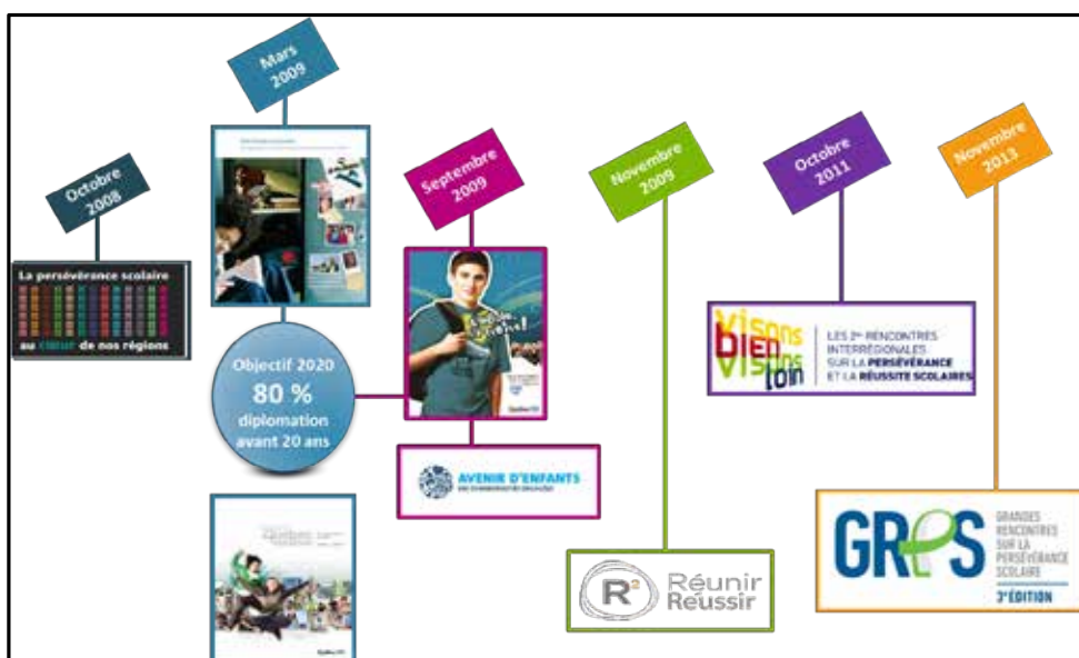
Figure 1 Les jalons d'un mouvement social au Québec, de 2008 à aujourd'hui

Depuis 1996, l'exemple du Conseil régional de prévention de l'abandon scolaire (CRÉPAS) au Saguenay-Lac-Saint-Jean, première IRC au Québec, a porté ses fruits. Aujourd'hui, les vingt IRC, postées dans chacune des régions du Québec, travaillent selon une même approche de concertation intersectorielle (souvent interordres d'enseignement) autour d'une prémisses similaire : le décrochage scolaire constitue une problématique sociale qui n'est pas seulement l'affaire de l'école. Puisque les effets du