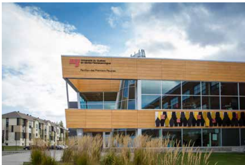
Pavillon des Premiers Peuples de l'UQAT

Service Premiers Peuples. (2013). Stratégies pédagogiques intéressantes auprès des étudiants autochtones . Val-d'Or, Canada : Campus de l'Université du Québec en Abitibi-Témiscamingue, auteur.