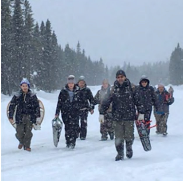
Figure 2. Énoncé de la compétence : Se déplacer en forêt de façon non motorisée (cohorte 2017-2018).