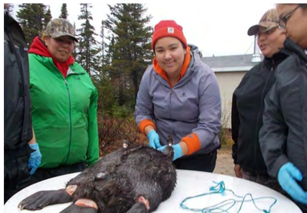
Figure 3. Énoncé de la compétence : Appliquer des notions de biologie animale (cohorte 2017-2018).

culturelle en formation professionnelle, mises en place par des directions, des personnes enseignantes et intervenantes, peuvent soutenir la persévérance et la réussite de jeunes et d'adultes des Premiers Peuples.