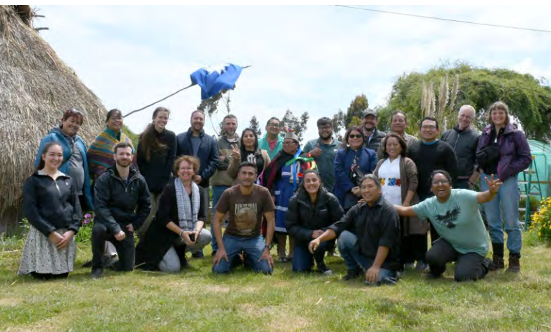
Figure 2. Une partie des membres du Partenariat Savoirs et éducation autochtones, Monkul Lof Mapu (Chili), octobre 2022.