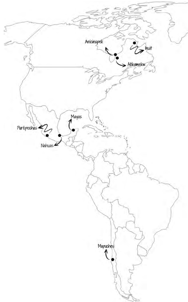
Figure 1. Localisation géographique des nations autochtones impliquées dans le PSÉA.

Sept nations autochtones sont impliquées dans le projet : 1) Atikamekw Nehirowisiwok; 2) Inuit du Nunavik; 3) Anicinabe de l'Abitibi-Témiscamingue; 4) Mapuche de l'Araucanie; 5) Maya du Yucatán; 6) Purépecha de Michoacán; et 7) Nahuas de Veracruz (Voir carte 1). La visée générale du projet répond : (a) à l'effort d'affirmation identitaire et de revitalisation de la culture et de la langue au sein de plusieurs nations autochtones; (b) aux appels à l'action de la Commission royale sur les peuples autochtones (CRPA) et de la Commission de vérité et réconciliation (CVR) – qui soulignent la nécessité de créer des programmes éducatifs autochtones mobilisant les savoirs et approches pédagogiques autochtones dans un objectif de persévérance scolaire et d'affirmation identitaire; (c) aux besoins ciblés par les communautés autochtones de développer des partenariats internationaux visant à partager leurs initiatives et à mettre en œuvre de nouvelles approches et outils éducatifs adaptés à leur réalité; (d) aux démarches d'autodétermination des peuples autochtones, notamment en matière d'éducation et de transmission des savoirs culturels.