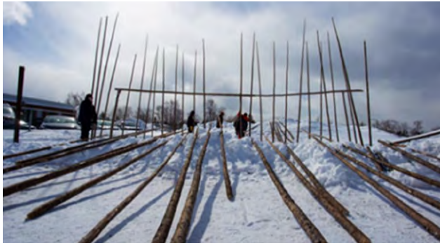
Figure 2. Construction d'un Shaputuan.

Les pistes à explorer pour la formation des enseignants et enseignantes ne se limitent pas à l'intégration de contenus à des cours, mais supposent de repenser la façon de les aborder « avec » et « par » des partenaires des Premiers Peuples.