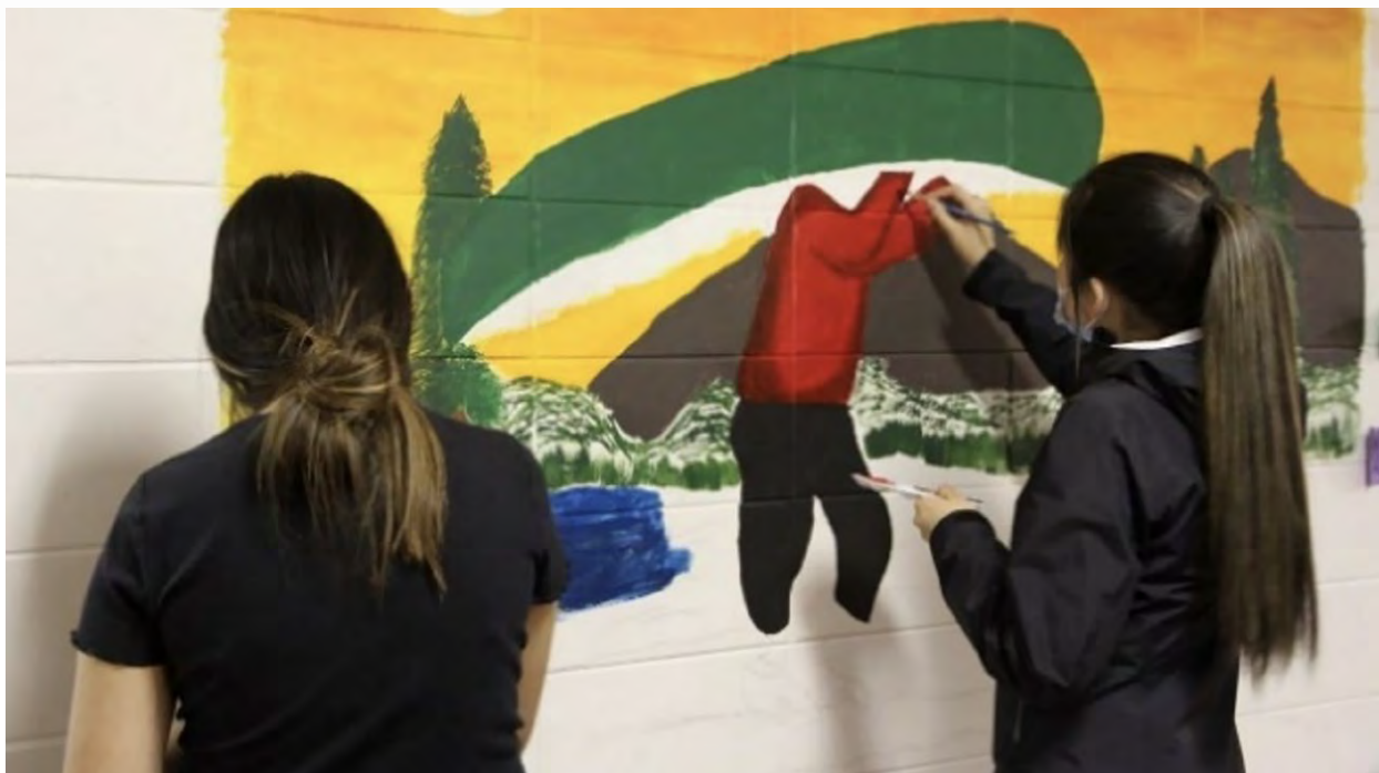
Figure 3. École Uashkaikan de Pessamit: murale collective.