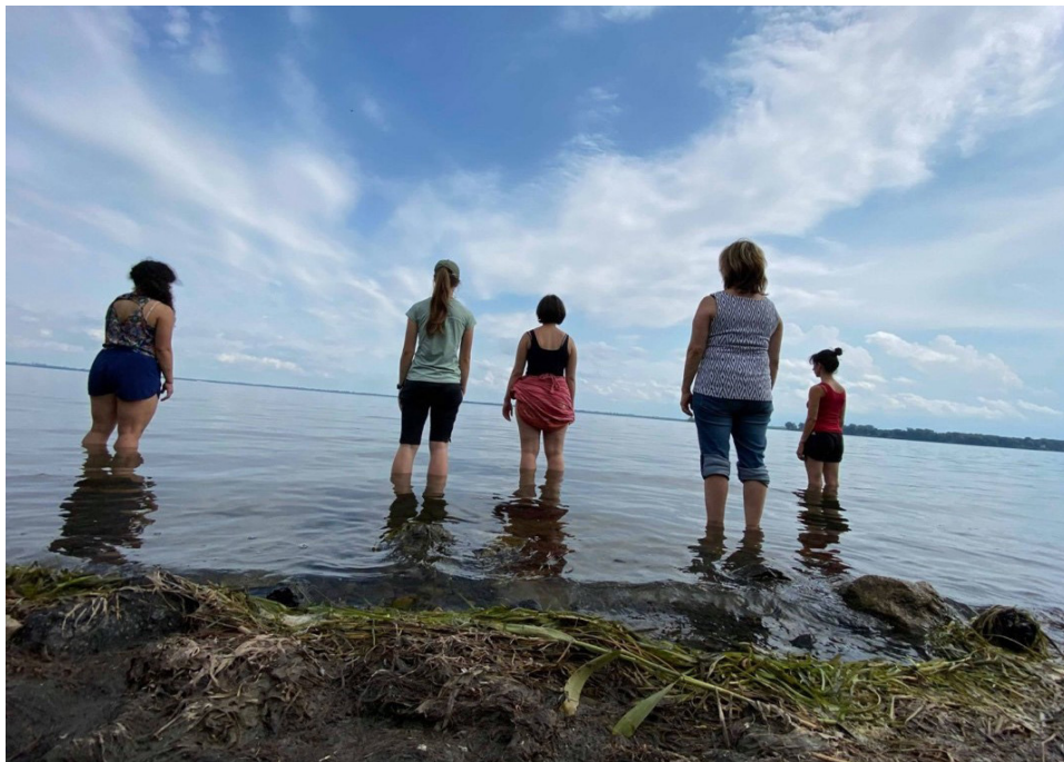
Figure 3. Méditation les pieds dans l'eau.

Enfin, nous avons, avec l'équipe, créé et appliqué une méthodologie collaborative ancrée dans l'action. En m'inspirant des méthodologies autochtones, j'ai choisi de travailler en cocréation avec l'équipe, afin de révéler des connaissances spatiales liées à la performance et, plus spécifiquement, à la danse. La coconstruction ou la cocréation est la mise en relation de différentes formes de savoirs. J'ai donc mis en place des laboratoires collaboratifs, nommés ici « collaboratoires ». Dans des espaces identifiés lors de l'étape 2 et par les membres de l'équipe, nous avons construit trois expériences de collaboratoires. Les collaboratoires se sont déroulés dans une partie du Parc de l'Honorable-George-O'Reilly à Verdun, à la Place des Festivals et à la Place Jacques-Cartier. J'ai tenté de rendre compte, dans cette partie, des réflexions collectives qui ont entouré la question de l'autochtonisation de ces espaces à travers la présentation de récits, d'analyses et de dessins.