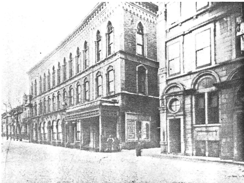
L'ACADÉMIE DE MUSIQUE vers 1900 Sur le côté, une affiche représentant James O'Neill (père d'Eugène) dans D'Artagnan.