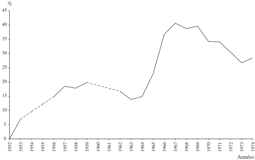
GRAPHIQUE N° 2 – Part des dettes à moyen et long termes dans le total du passif