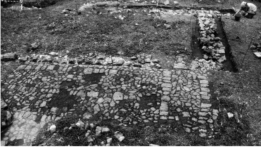
Chantier de fouille de l'habitation d'Anglemont