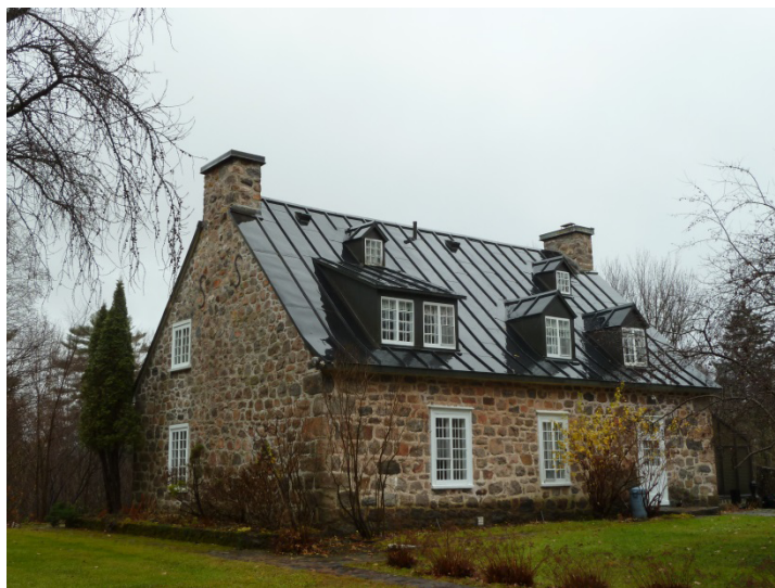
Figure 4 : Le manoir.