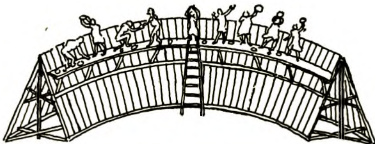
La palissade iroquoise selon Jacques Cartier