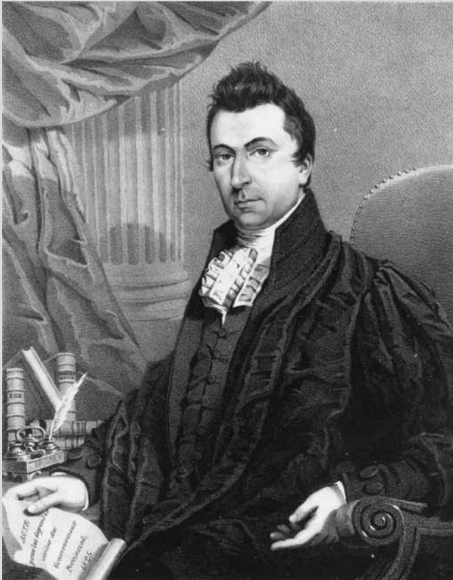
Portrait gravé de Louis-Joseph Papineau (1832).