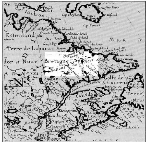
Figure 1. Détail de Amérique Septentrionale de N. Sanson (1650)

Toutes les appellations énumérées dans ce texte semblent désigner des groupes régionaux, mais leur localisation est vague. Situées au nord par rapport à Tadoussac, ces « petites nations » n'étaient pas en contact avec les Européens, mais elles entretenaient des relations commerciales avec les Indiens de Tadoussac et de Sillery, déjà en voie de christianisation. On ne peut s'empêcher d'établir un lien entre la Relation