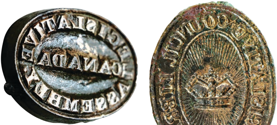
À gauche le tampon encreur de l'Assemblée législative (L: 32 mm), à droite le sceau de la bibliothèque du Conseil (H: 29 mm). Collection Ville de Montréal.