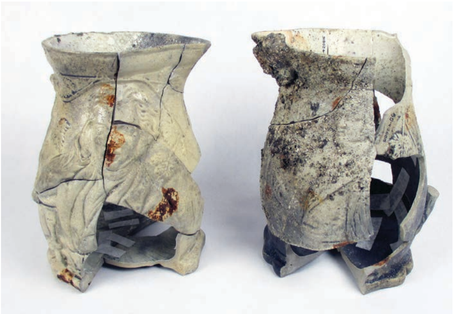
Les pichets arborant sur leurs faces opposées les figures de Cobden et Peel. Hauteur: 12 cm. Collection Ville de Montréal.