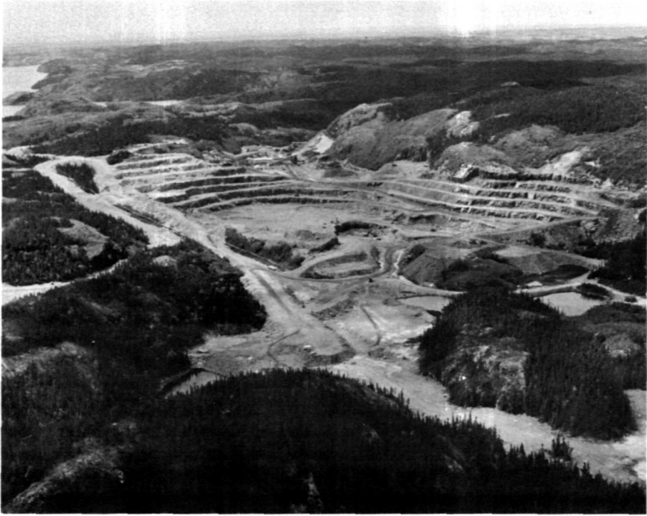
Photo 1 L'exploitation minière de la société F.T.Q. aux lacs Allard-Tio. Extraction à ciel ouvert par la méthode de « gradins ». Dans la partie supérieure gauche, l'usine de concassage, le bâtiment administratif et le terminus de la voie ferrée. Plus à l'ouest, une partie du lac Allard. À remarquer également la sub-horizontalité du plateau laurentien.

Aucune communication terrestre ne relie Havre-Saint-Pierre au reste du Québec, la route 138 s'arrêtant à la rivière Moisie, une quinzaine de milles en aval de Sept-Îles 1 . Une voie ferrée relie le port aux installations minières situées à 27 milles (43 km) au nord (photo 1). Le trafic aérien est assuré par la compagnie Québecair qui effectue des envolées quotidiennes entre ce centre et les villes de Sept-Îles, Québec et Montréal. Jusqu'en 1960 cependant, les communications étaient en grande partie effectuées par certains organismes maritimes, telle la Clarke Steamship , ainsi que par des caboteurs individuels.