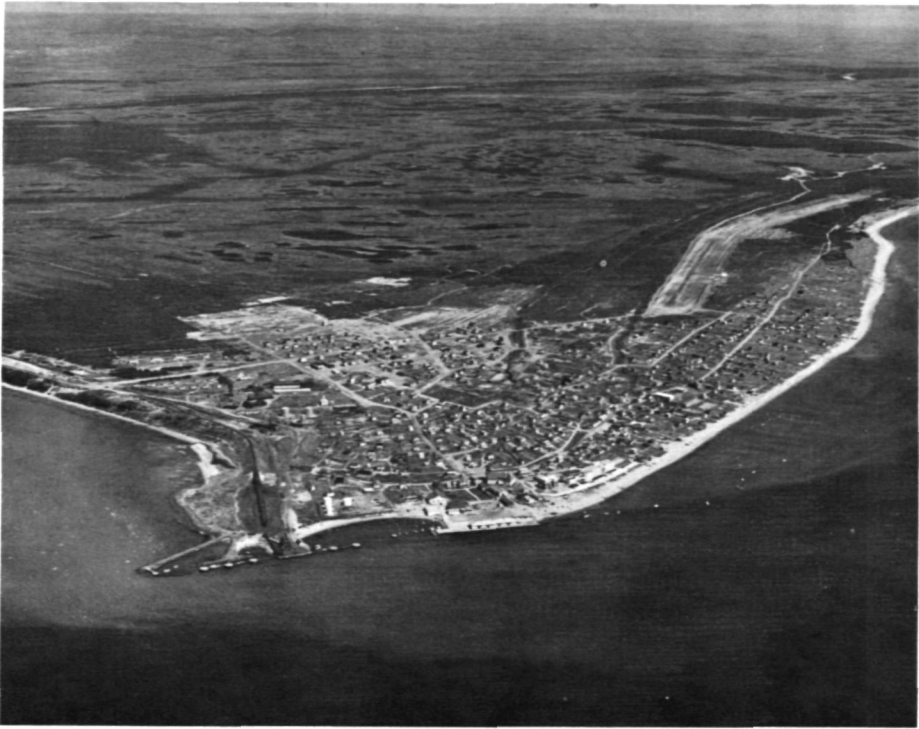
Photo 2 Vue aérienne de Havre-Saint-Pierre. Dans la partie inférieure gauche, les installations portuaires de la compagnie dont l'appointement prolongé par les « ducs d'albe ». Vers la droite, le quai du ministère fédéral des Transports. À l'arrière-plan, la plaine basse et marécageuse qui ceinture à demi l'agglomération, plaine drainée par la Romaine. Dans la partie est de la ville, la piste aérienne utilisée par Québecair pour desservir le secteur.

le reflux vers l'est avec une vitesse d'environ un nœud. Par forts vents d'ouest, les courants de reflux peuvent atteindre 2 nœuds quoique cela survienne rarement.