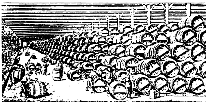
Chai ou cellier