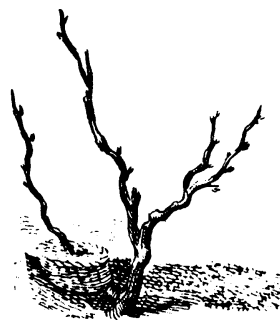
Plant de marcotte