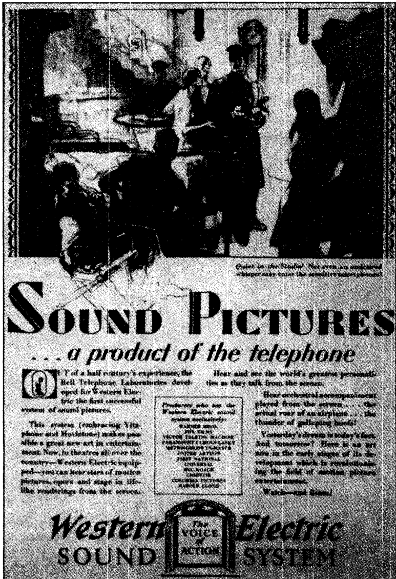
Illustration 4. Publicité de la Western Electric, provenant de Life (± 1929)

nouvelle technologie audiovisuelle comme une simple extension de la téléphonie.