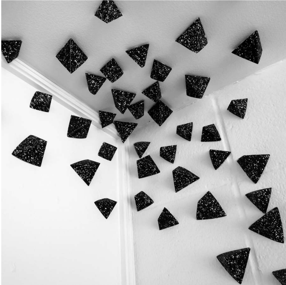
Andrée-Anne Dupuis Bourret, Paper Fiction (détail), 2011. Papiers sérigraphiés, gommettes. Hostel Hi, Winnipeg, Manitoba.