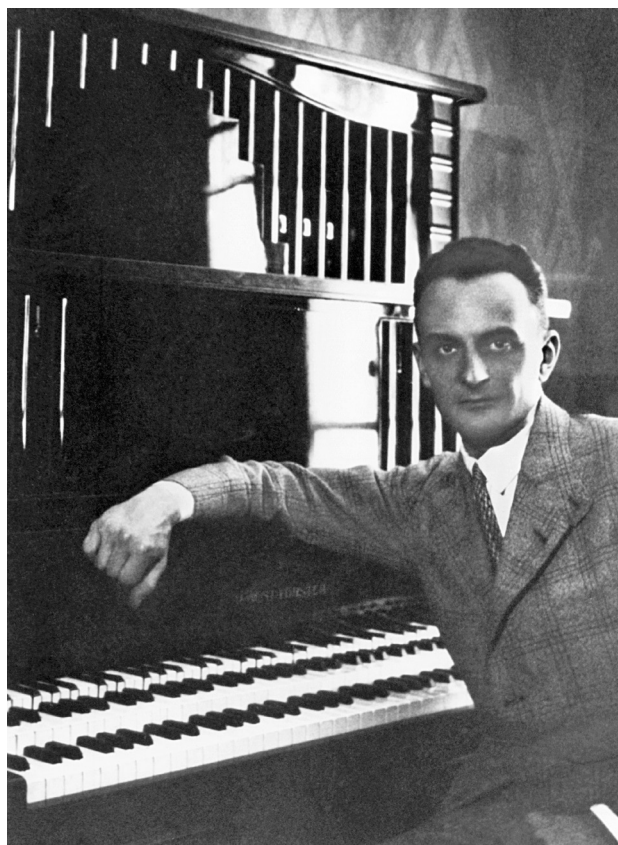
PHOTO Ivan Wyschnegradsky, chez lui à Paris, devant son piano trois claviers, en 1929.