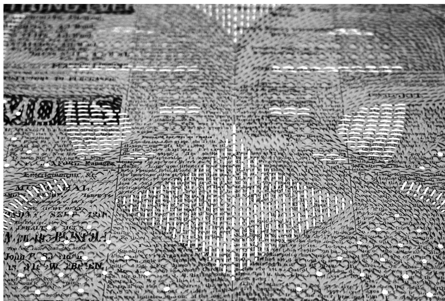
Myriam Dion, Train Robbery, Jesse James, The Morning Mail, September 10, 1881 (détail), 2018. Papier journal coupé au couteau x-acto, collage de papier japonais et feuille d'or, 44,5 × 60 cm.