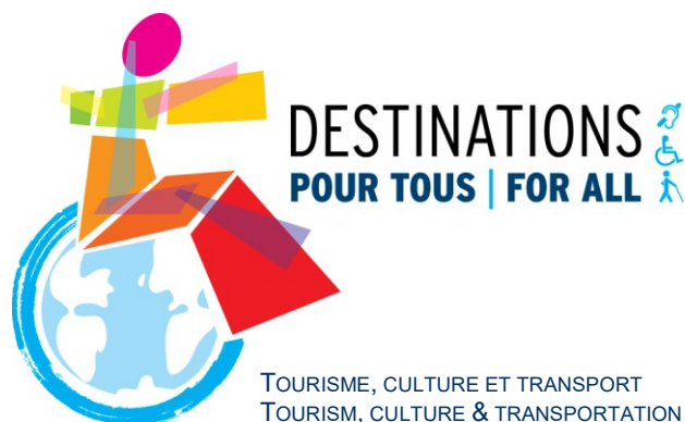
ILLUSTRATION 1 : LOGO DU SOMMET MONDIAL DESTINATIONS POUR TOUS

Cet événement a permis de partager l'expertise des partenaires et de mettre en œuvre une stratégie commune à l'international pour développer le tourisme pour tous. Le Comité directeur de ce premier Sommet mondial comptait notamment les représentants de l'Organisation mondiale du tourisme, de l'Organisation internationale du tourisme social et de l' European Network for Accessible Tourism (ENAT).