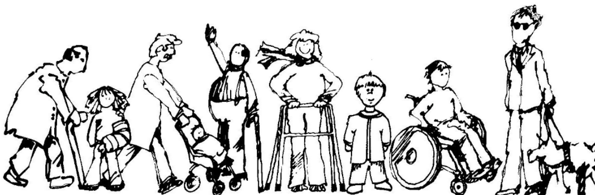
ILLUSTRATION 3 : L'ÉLIMINATION DES OBSTACLES BÉNÉFICIE À TOUS LES CITOYENS. (KÉROUL, 1997)