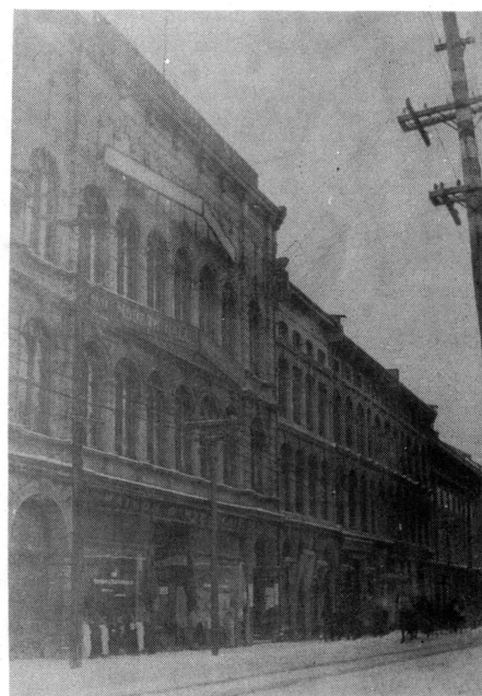
L'Institut logeait dans l'édifice le plus élevé.

De 1850 à 1880 les deux partis se livrèrent une lutte sans merci par l'entremise de leur journaux, puis ils s'affrontèrent devant les tribunaux. On en connaît les résultats: le mouvement libéral fut écrasé; l'Institut, épuisé par le conflit judiciaire, dut vendre sa bibliothèque afin de payer sa dette. Cependant, cette bibliothèque a joué un rôle important avant de disparaître. De 1865 à 1880, elle prêta plus de 40 000 volumes à 1 700 clients. Face aux condamnations cléricales les directeurs de l'association avaient décidé en 1872 de rendre leur bibliothèque plus accessible. La bibliothèque devint