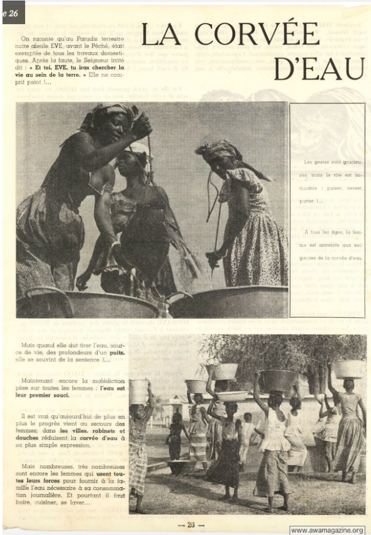
Figure 4 – Awa, mars 1964, p. 26.

pauvreté extrême (voir figure 4). Cette prénomination et surtout la manière dont le magazine file son interprétation montrent que les conceptrices du magazine avaient conscience de la difficulté de leur tâche. Si Awa désigne pour certains lecteurs le fantasme du magazine, pour ses rédactrices, ce nom renvoie à son inconscient.