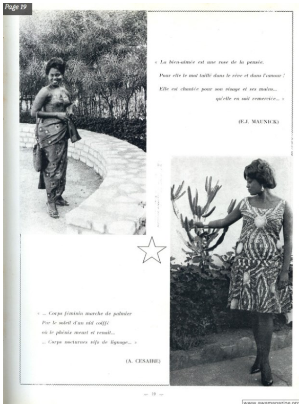
Figure 1 – Awa, février 1964.

Alors Awa , un magazine ? Ce n'est pas si simple. Il faut reconnaître la complexité du positionnement. La presse magazine est fondée sur le recours massif à la publicité comme financement et quand elle est féminine, elle cible, grâce à des annonceurs de produits de beauté, les femmes comme consommatrices. Or, pour Awa , il existe un écart certain entre le lectorat et les annonceurs. Les publicités viennent d'agences de voyage, d'hôtels, de librairies, de représentants pour des machines à écrire mais aussi d'une société anonyme d'études et de réalisations techniques : la revue explique plus tard qu'il s'agit de relations et de sympathisants. Les photographies de mode envoyées par les lectrices mettent en avant leur garde-robe et constituent un miroir coquet mais globalement dépourvu d'enjeux commerciaux et publicitaires (voir figure 1).