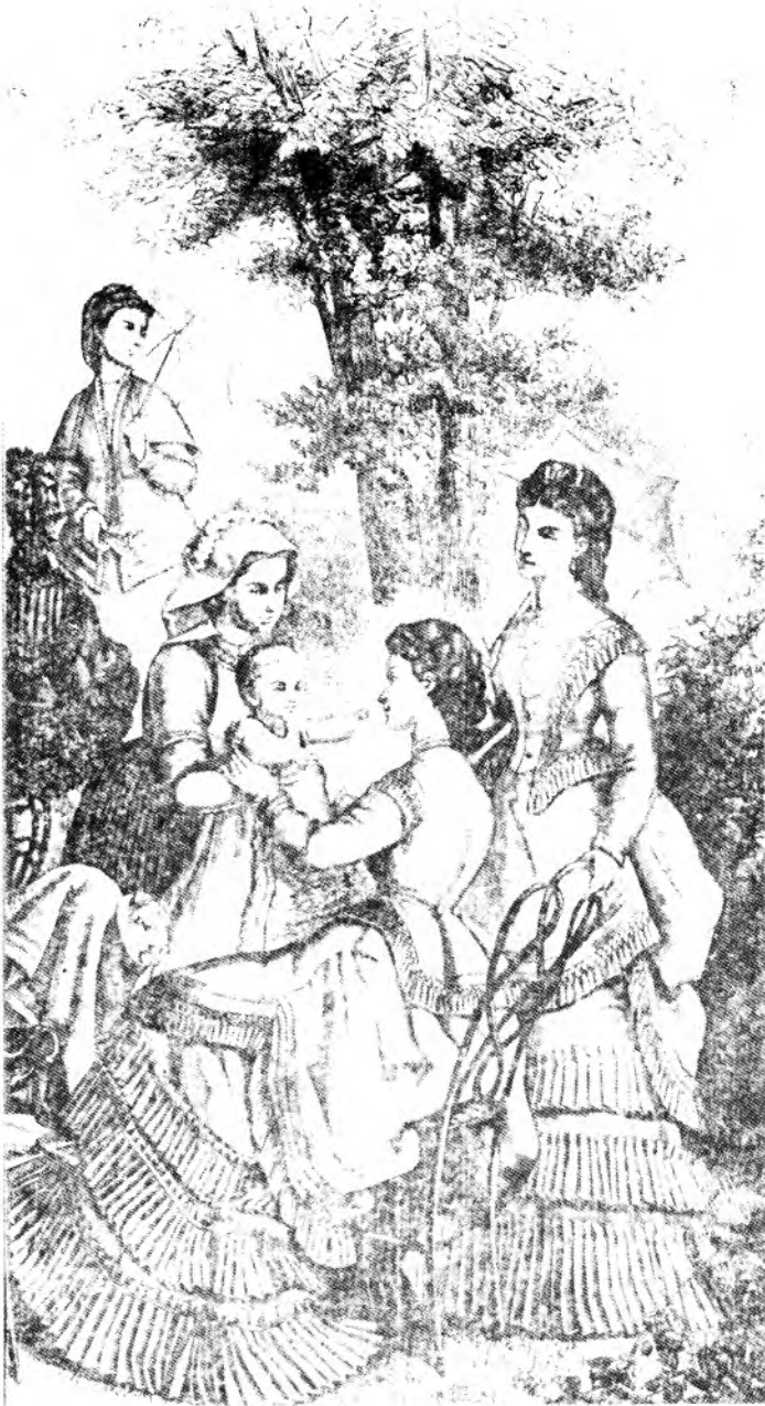
Figure 3: "Summer Fashion. Afternoon Toilette of Foulard Ecrû", tiré du Canadian Illustrated News , 1 er juillet 1871, p. 9.