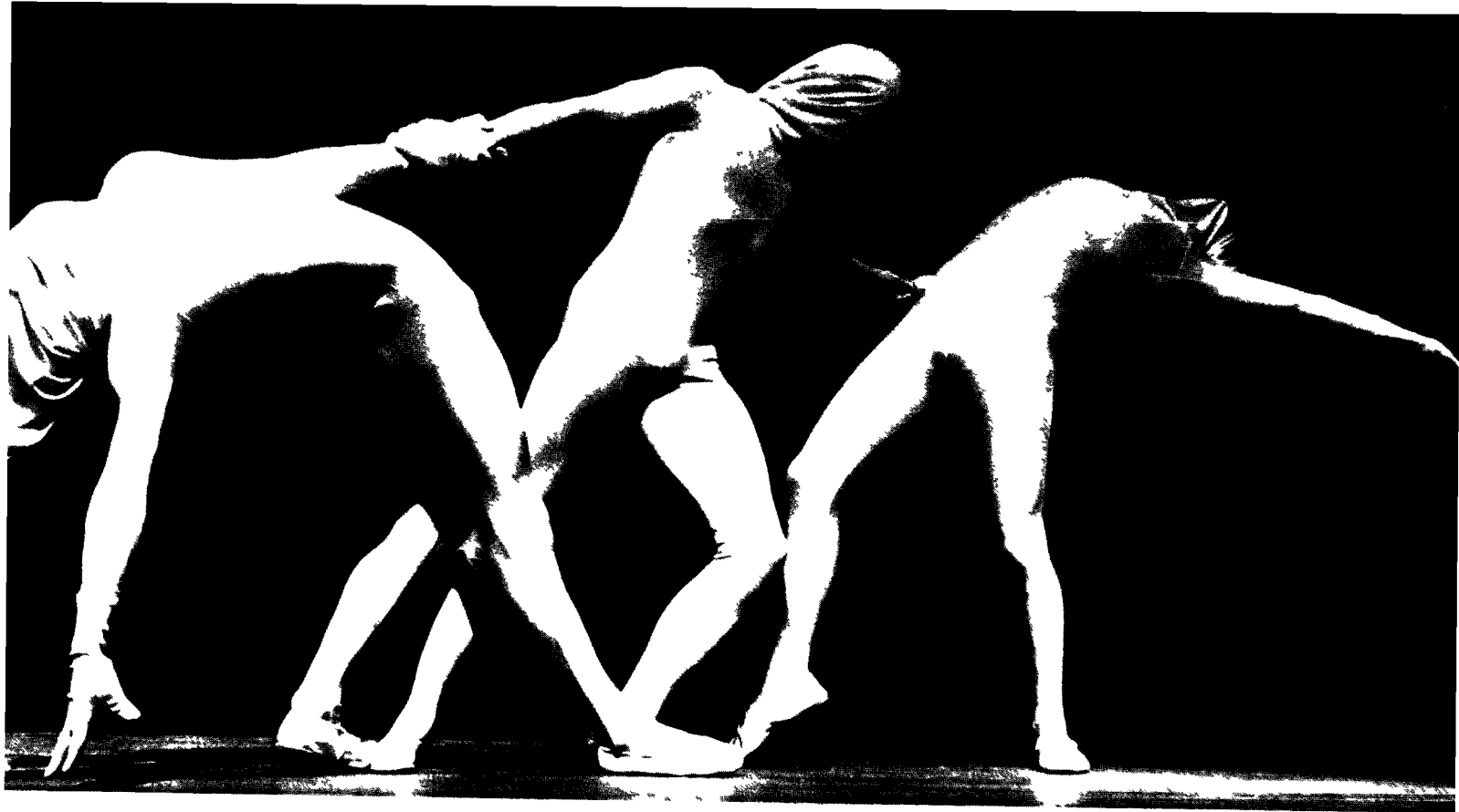
Théâtre de l'Entrecorps (1978).