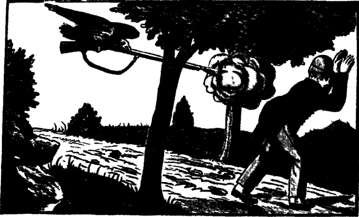
L'oiseau qui tue le chasseur