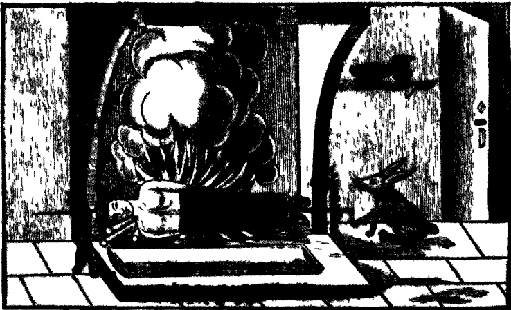
Le lièvre qui fait cuire le rôtisseur.