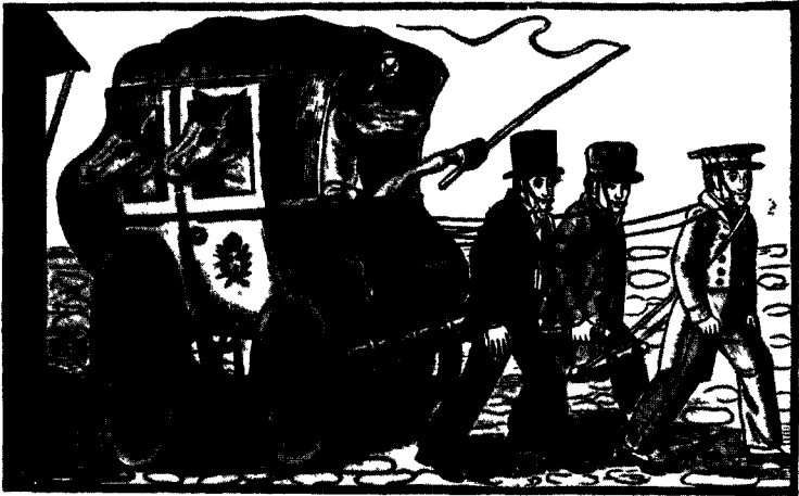
Les chevaux dans la diligence qui se font traîner par les voyageurs. (Fabrique Pellerin, Épinal)