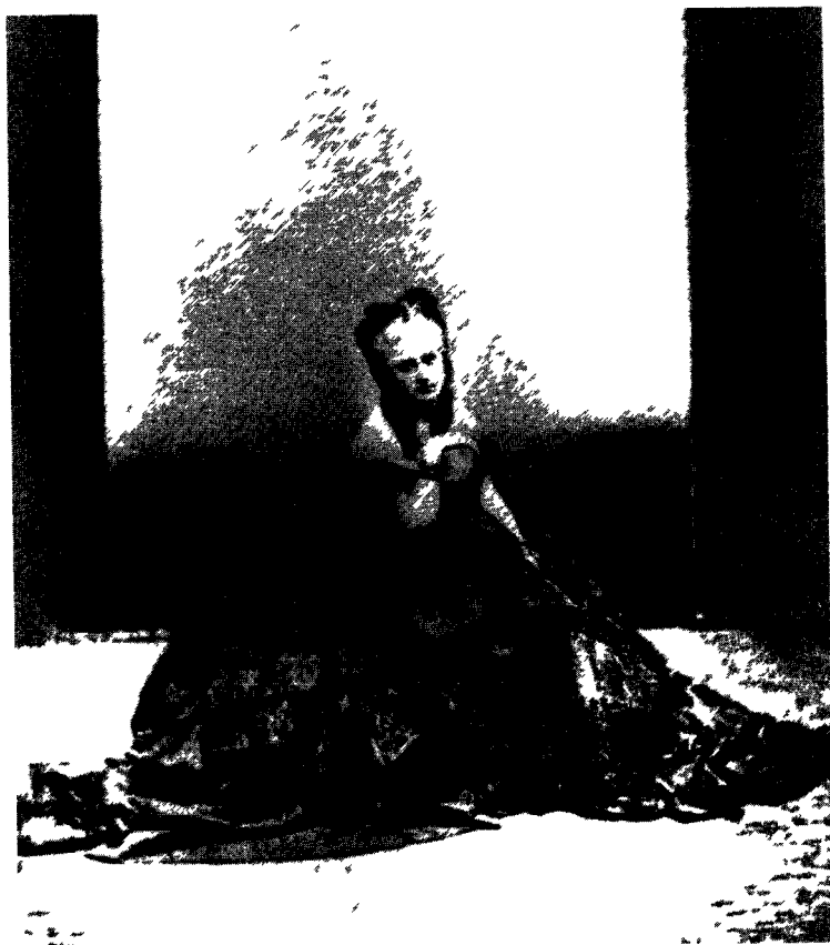
La comtesse de Castiglione (1837-1899)