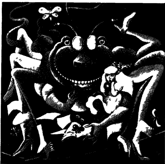
Page couverture de le Sourire de l'Araignée , Lausanne, Editions de l'Aire, 1979, Illustration de Jocelyne Pache