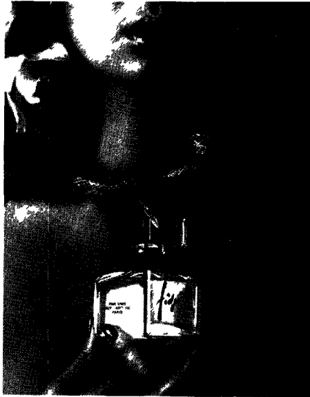
Fidji de Guy Laroche.