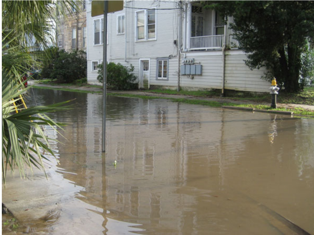
Fig. 2 – Mapple Street, inondée en deux heures après une pluie intensive (plus de 5 cm/h).

les parties les plus anciennes du système ayant une capacité moindre. Nous nous référons à ces nombreuses inondations dont sont victimes toute l'année certains microreliefs de la ville (voir Figure 2).