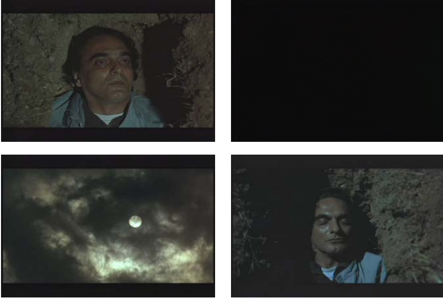
© Abbas Kiarostami, Le goût de la cerise, (photogrammes extraits du film).