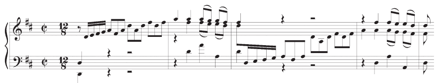
Figure 2. Clavier bien tempéré, Deuxième livre, Prélude # 5, mes. 1–4

Les premières étapes de la composition de l'œuvre ont donc été marquées par un travail de terrain pour lequel j'étais moi-même le sujet d'étude : je me suis installé au piano et ai passé en revue toutes les pièces de Bach que j'ai déjà jouées et aimées. J'en ai choisi trois : le Cinquième Prélude du Deuxième livre du Clavier bien tempéré , une harmonisation du choral Es Ist Genug 11 et l' Allemande de la Partita # 1 en sib majeur .