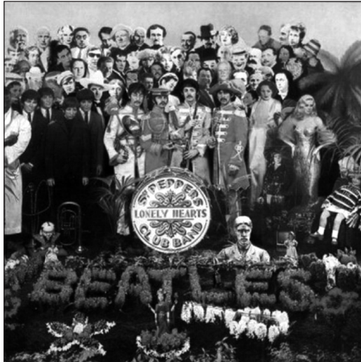
Figure 2. Pochette du disque 33 tours des Beatles intitulé Sgt Pepper's Lonely Hearts Club Band (1967)

un caractère pleinement « rock » d'un quintette amplifié se confrontant à des doubles fantomatiques enregistrés au préalable 146 .